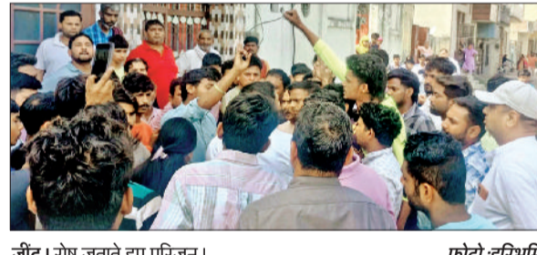
जींद। रोष जताते हुए परिजन।