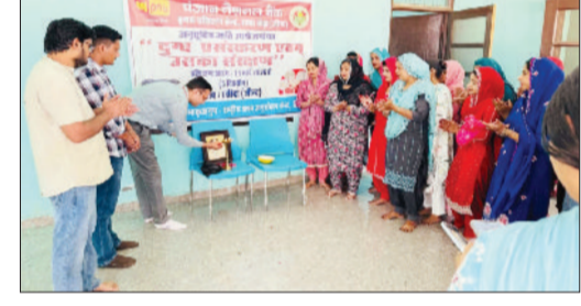
नरवाना। प्रशिक्षण शिविर का शुभारंभ करते हुए।