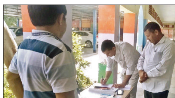
जीद। प्रश्न पत्रों की जांच करते हुए बोर्ड उपाध्यक्ष।