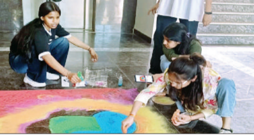
जींद। रंगोली प्रतियोगिता में भाग लेते छात्र।