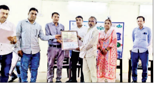
जींद। प्लम्बर दिवस पर सम्मानित करते हुए।