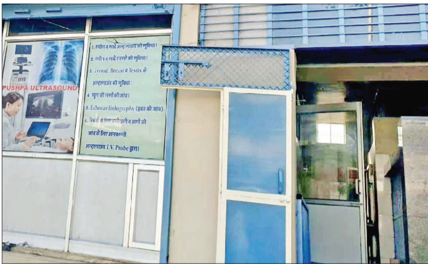
जीद। अल्ट्रासाउंड केंद्र के बाहर लिखे गए दिशा-निर्देश।

स्वास्थ्य विभाग द्वारा पीएनडीटी एक्ट के प्रभावी क्रियाव्यव को लेकर जिले में चल रहे अल्ट्रासाउंड केंद्रों की जांच की जाएगी। पीएनडीटी एक्ट के तहत यह अल्ट्रासाउंड खरे उतरे हैं या नहीं, स्वास्थ्य अधिकारियों द्वारा इसको जांच जाएगा। इसके लिए एक एसएमओ तथा एक अन्य चिकित्सक की टीम बनाई है। पूरे जिले में 39 अल्ट्रासाउंड केंद्र व मेटरनिटी अस्पताल हैं। सभी केंद्रों की जांच 31 मार्च तक सिविल सर्जन को सौंपनी होगी। पीएनडीटी एक्ट के तहत एक फार्म जारी किया गया है। इसमें जो-जो प्वायंट हैं, उन सभी को अल्ट्रासाउंड संचालकों को पूरा करना होगा। स्वास्थ्य विभाग द्वारा समय-समय पर पीएनडीटी एक्ट के तहत अल्ट्रासाउंड केंद्रों की जांच की