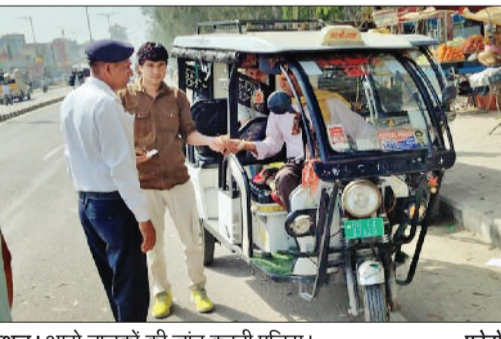
कैथल। आटो चालकों की जांच करती पुलिस।