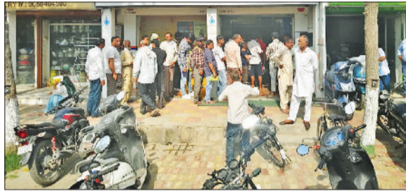
कैथल। गैस सिलेंडर बुक करवाने के लिए लगी उपभोक्ताओं की कतार व जींद में भारत गैस सप्लाय के सिलेंडर।